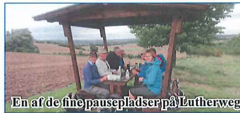
En af de fine pausepladser på Lutherweg