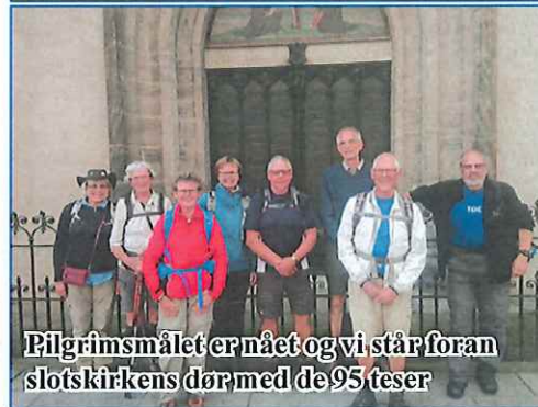
Pilgrimsmålet er nået og vi står foran slotskirkens dør med de 95 teser