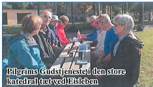
Pilgrims Gudstjeneste i den store katedral tæt ved Eisleben